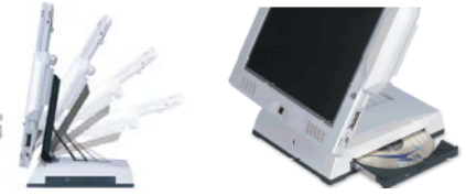
Tablet PC con Docking Station